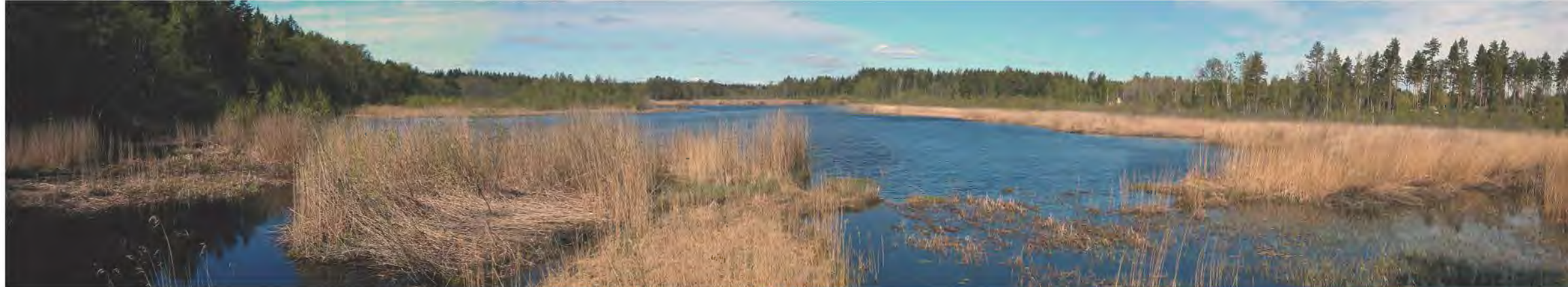
Utsikt från östra fågeltornet

I området saknas toaletter och soptunnor.