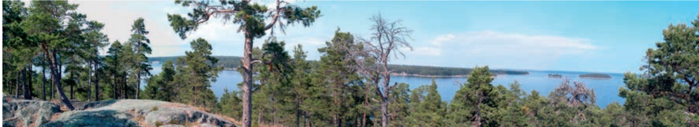
Utsikt från Skatberget