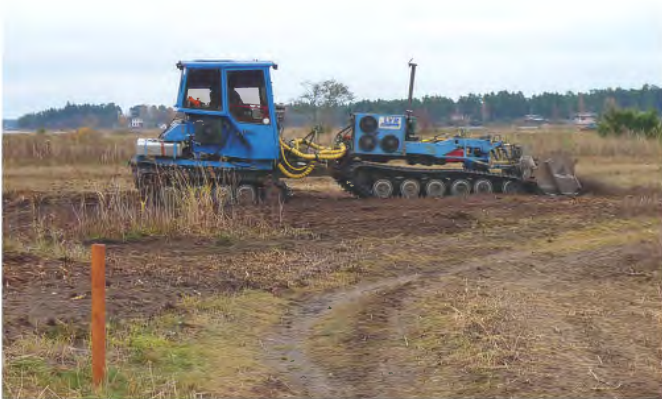
Stubbar av tall och klibbal har frästs bort med specialmaskiner

högvuxna gräs. Slåttern motverkar förnaansamling och igenväxning. Det gynnar de mer småvuxna och konkurrenssvaga ängsväxterna. De tätaste vassruggarna har rotfrästs för att bromsa vassens utbredning. Även stubbar av skottskjutnade träd som klibbal har frästs bort.