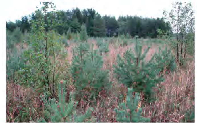
Stenöorn före restaureringen...

period av kraftig igenväxning. På ängarna spirade tallplantor och lövsly och bladvassen ökade kraftigt längs stränderna. Naturreservatet fick en ny skötselplan 2009 och året efter påbörjade länsstyrelsen omfattande restaureringar för att åter göra Stenöorn till en bra miljö för fåglar och strandängarnas växter.