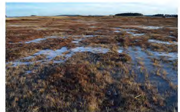
... och samma vy efter restaureringen.

När restaureringen av Stenöorn började 2010 var den en gång öppna udden kraftigt igenvuxen. Flera skogsdungar hade etablerat sig och stora delar täcktes av täta bestånd av unga tallar. Ruggar av bladvass dominerade längs stränderna. Efter att träd och buskar nu har avverkats och körts ut har större delen av udden slagits med slättermaskin för att få bort bladvass och