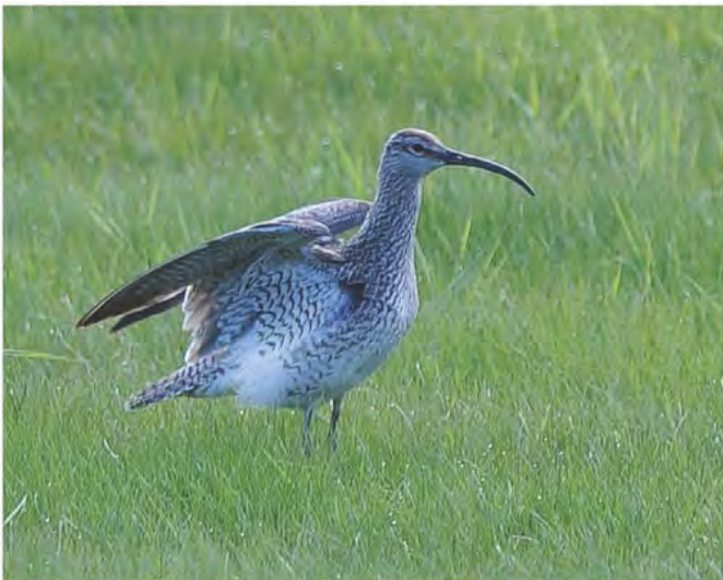
Småspoven rastar på Stenöorn och äter gärna kråkbär

Efter de första årens restaureringsinsatser kommer reservatet att skötas med årlig bortröjning av träd och buskar. Slätter av strandängarna kommer att ske med något glesare intervall, fräsning av bladvass görs vid behov. Restaureringarna har gjorts i samarbete med Resurscentrum på Söderhamns kommun, samt av lokala entreprenörer på uppdrag av Länsstyrelsen.