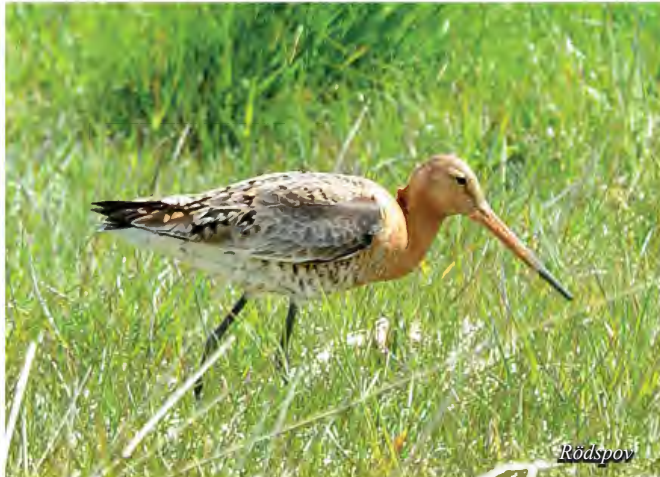
De flesta svenska vadararterna har setts på Stenöorn.

här. De vidsträckta öppna strandängarna ger också bra förutsättningar för de fåglar som väljer att häcka i området, såväl vadare som andra.