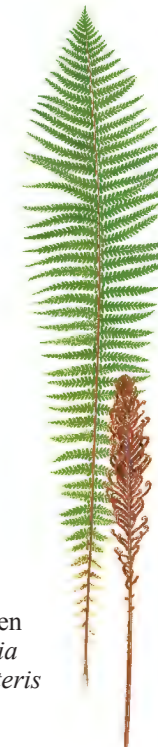
Strutbräken Matteuccia struthiopteris

I den gamla skogen lever hackspettar, rovfåglar och tättingar. Längs med en porlande bäck växer stinksyska, gullpudra och den storvuxna ormbunken strutbräken.