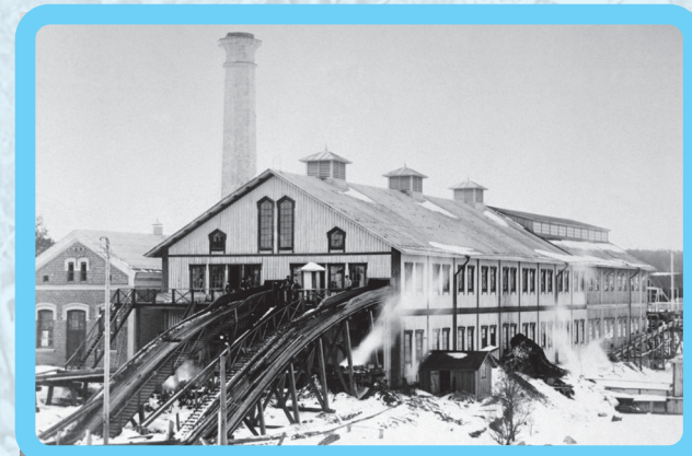
Långrörs sågverk på 1920-talet

Det sägs att det var ca 400 skutor som väntade på last när isarna gick upp.